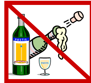
Limite el alcohol